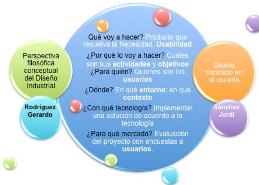
Figura 2. Coincidencias de la Filosofía del Diseño Industrial y el Diseño centrado en el usuario.