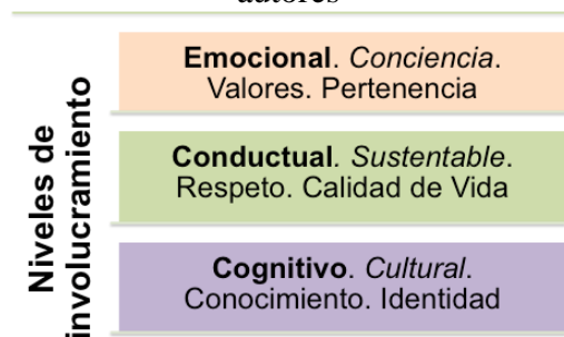
Figura 3. Niveles de involucramiento del Modelo Humanista y las líneas de investigación de los autores

El modelo humanista se basa sobre todo en los usuarios y esto implica el conocimiento de sus actividades, su cultura, su lenguaje, para construir conocimiento en el ámbito educativo. Dicho modelo implica tres niveles de involucramiento: Emocional, Conductual y Cognitivo, los cuales producen y fortalecen la necesidad del estudiante y de su proceso de formación como una persona competente. A continuación se relacionan estos niveles con la propuesta de enseñanza diseñística sustentable, el cual se muestra en la figura 3.