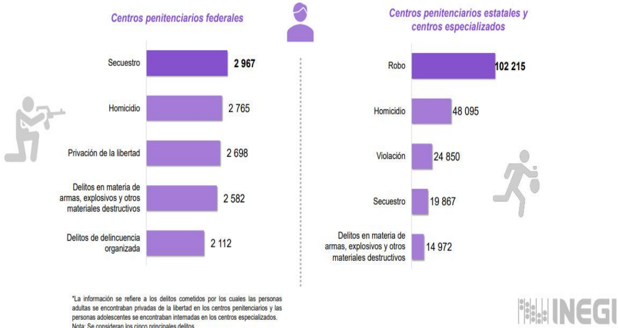
Figura 2 Delitos cometidos por mujeres en centros penitenciarios federales y estatales.