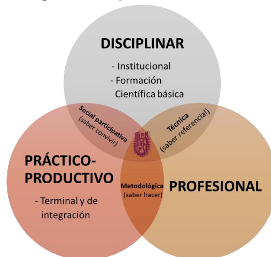
Figura 2. Componentes del MEI