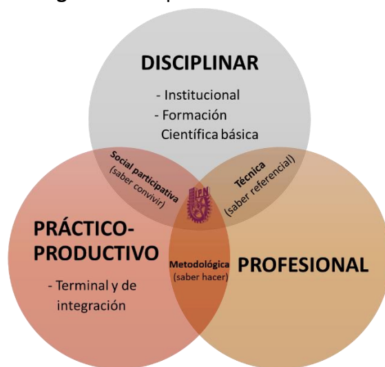
Figura 2. Componentes del MEI